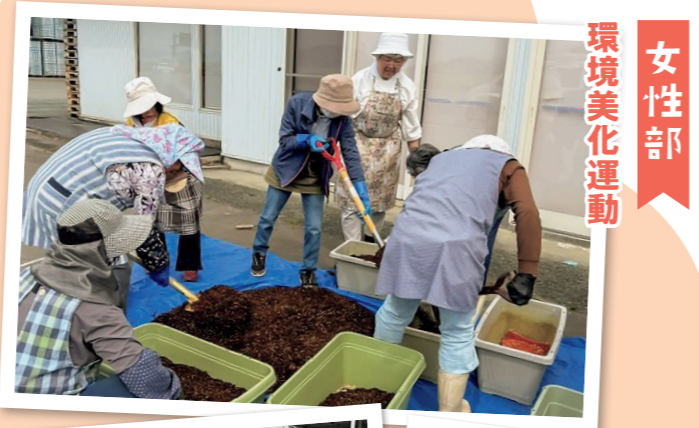
女性部 環境美化運動