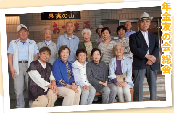
東部事業所 北久野本 年金友の会総会