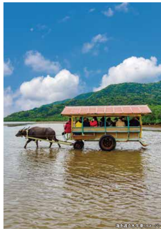
海を渡る水牛車(イメージ)

八重山観光で大人気の竹富島。一歩足を踏み入れれば、そこには時が止まったかのような沖縄の原風景が広がっています。サンゴの石垣に囲まれた赤瓦の民家、そして道を彩る鮮やかなブーゲンビリア。白砂の道をのんびりと歩けば、古き良き琉球の息吹が今も息づいていることを肌で感じられるはずです。また西表島では大自然の息吹を感じる仲間川マングローブクルーズをお楽しみ下さい。