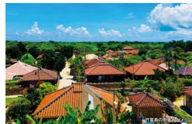
竹富島の街並み(イメージ)

八重山観光で大人気の竹富島。一歩足を踏み入れれば、そこには時が止まったかのような沖縄の原風景が広がっています。サンゴの石垣に囲まれた赤瓦の民家、そして道を彩る鮮やかなブーゲンビリア。白砂の道をのんびりと歩けば、古き良き琉球の息吹が今も息づいていることを肌で感じられるはずです。また西表島では大自然の息吹を感じる仲間川マングローブクルーズをお楽しみ下さい。