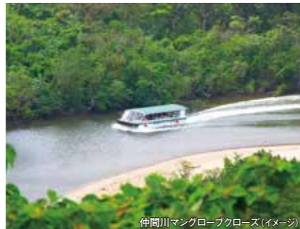
仲間川マングローブクルーズ(イメージ)