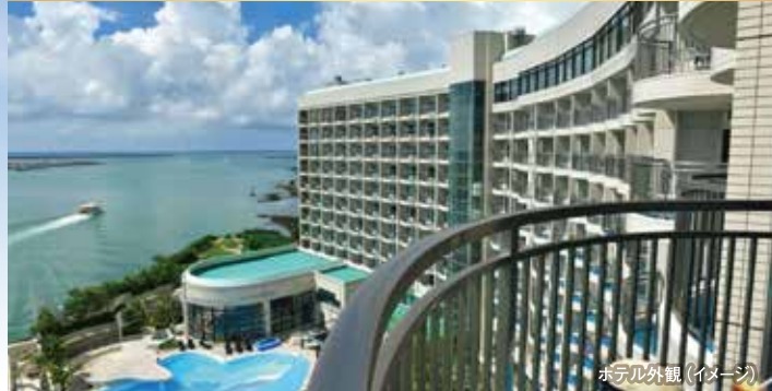
ホテル外観(イメージ)