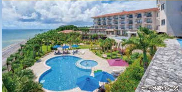
ホテル外観(イメージ)