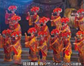
琉球舞踊 四つ竹(イメージ)