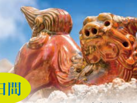
シーサー(イメージ)